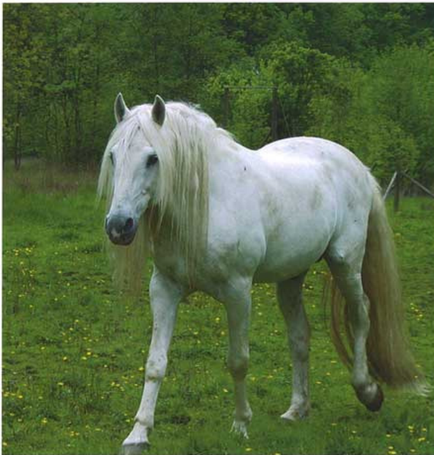
Links en onder: Berberhengst Jihal